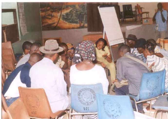
Groupe de Travail lors du Forum de Man

Dans toutes les localités où eurent lieu les forums, le manque d'information des populations en ce