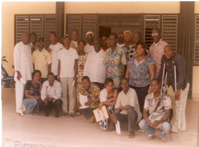
Groupe de Travail à Duékoué