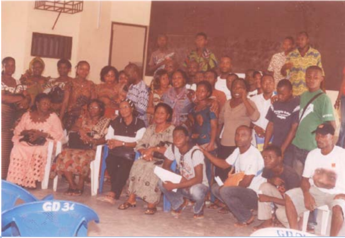
Les participants au dialogue Communautaire de Sassandra

Tous ces objectifs répondaient à un but général qui est celui du projet, à savoir