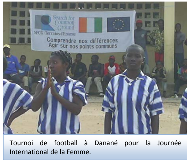
Tournoi de football à Danané pour la Journée Internationale de la Femme.

Pour plus de détails, Voir Rapport sur l'enquête d'audience annexée au présent rapport.