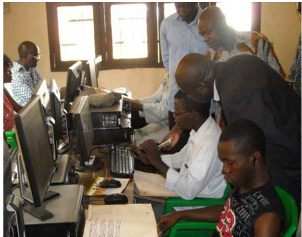
Les participants à la formation s'exercent aux techniques de reportage pour la réalisation d'une émission.