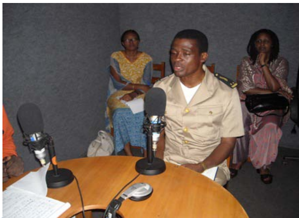
Un représentant du Gouvernement lors d'une émission sur la Reconstitution des Registres d'Etat Civil.

Grâce à ce projet, SFCG a développé et continue de développer des bonnes relations avec les autorités surtout à travers les émissions radios qui trouvent en SFCG une plateforme d' et un pont de liaison avec les communautés qu'ils représentent.. SFCG leur donne l'occasion d'apprendre à travers les émissions, les points de vue des populations et saisissent l'occasion de fournir des informations et ou réponses liées aux préoccupations des populations. Certaines autorités ont approché SFCG pour l'encourager à étendre son travail aux autorités qui , aussi ont besoin de renforcer davantage leurs connaissances sur les notions de démocratie et de bonne gouvernance.