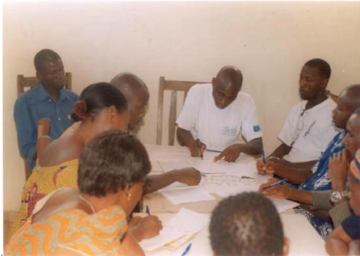
Séances de travail entre jeunes et femmes

Les participants ont eu l'occasion de discuter avec les représentants des différents groupes politique et ethnique sur certaines thématiques de la démocratie comme la manipulation politique, la tolérance et la cohabitation pacifique.