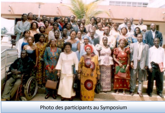
Photo des participants au Symposium

dans ces deux pays a particulièrement retenu l'attention des participants.