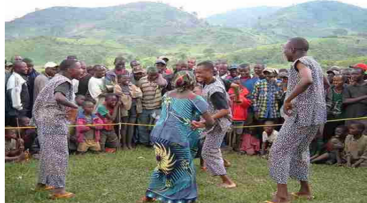
Une des troupes de théâtre participatif en plein travail à Kalehe.

En août, SFCG a présenté en RDC un nouvel outil lié à la transformation des conflits: le théâtre participatif. Cette méthode innovatrice, culturellement appropriée consiste à former les acteurs aux techniques élémentaires d'analyse et de transformation de conflit, leur permettant d'identifier, de comprendre et d'adresser un conflit à travers un théâtre interactif. De courtes pièces sont développées, elles sont basées sur des conflits réels que les acteurs ont découvert suite à leurs échanges avec les communautés. La pièce est jouée scène par scène et ensuite l'audience est invitée à rejoindre les acteurs sur la « scène » et à « rejouer » la pièce, en transformant cette fois les attitudes et comportements qui conduisent au conflit. Après une pièce de SFCG, une spectatrice a dit, « les pièces (de SFCG) représentent ce que nous vivons tous les jours. Après la représentation, j'ai réussi à aller à la rencontre de la personne avec qui j'étais en conflit pour lui parler. Merci ». Selon l'administrateur de Walungu, province du Sud Kivu déchirée par la guerre, « ces acteurs savent découvrir nos problèmes et ensuite les présenter afin que nous trouvions les solutions. Je n'ai jamais vu cela auparavant. Ces acteurs devraient venir plus souvent ».